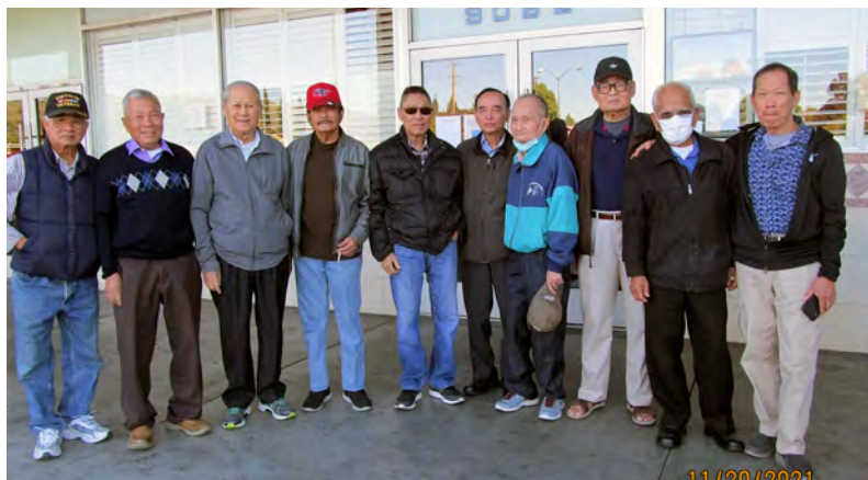
Các CSVSQ Khóa 20 chụp ảnh lưu niệm.

Thằng Hùng còn kể cho tôi nghe, một lần đi thực tập bài học Chiến Thuật “Nguy Trang và Ấn Núp” trong vùng địa hình của Ấp Thái Phiên, anh đã có những sáng kiến khá độc đáo. Tôi nhớ bài học này tôi cũng đi tham dự nhưng không có