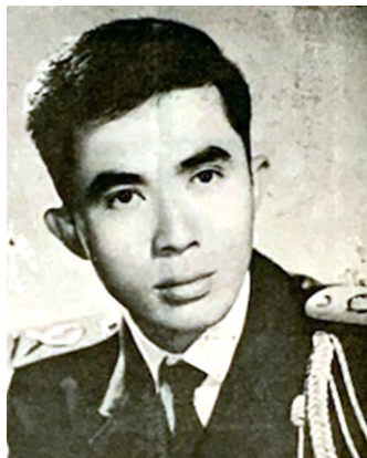
SVSQ Đổ Bá, Khóa 20, 1964

Tôi còn nhớ câu chuyện vui hôm ấy, anh kể trong giờ giải lao với đề tài “may má, may tay” khá duyên dáng. Và sau đó, suốt “tám tuần sơ khởi”, thỉnh thoảng anh còn kể nhiều chuyện vui khác nữa. Thế mà từ dạo đó đến nay, thấm thoát đã 58 năm rồi, nhanh